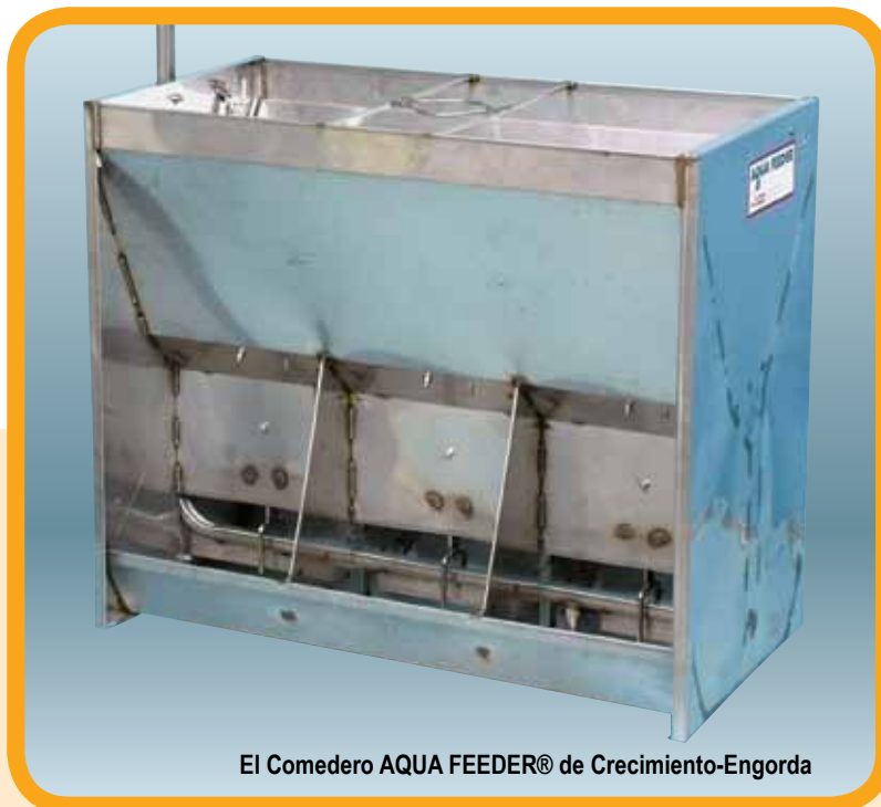
El Comedero AQUA FEEDER® de Crecimiento-Engorda