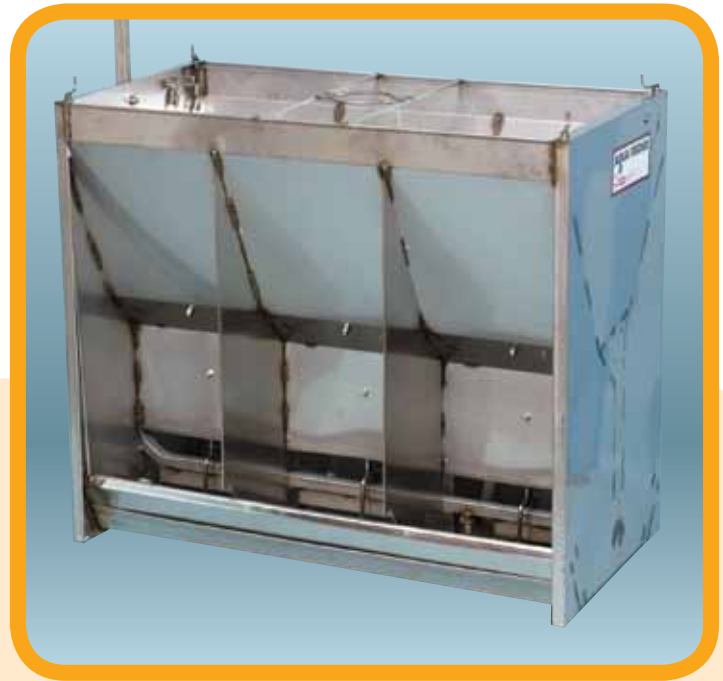
El Comedero AQUA FEEDER® de Crecimiento-Engorda con Borde Ajustable para Ahorrar Alimentos